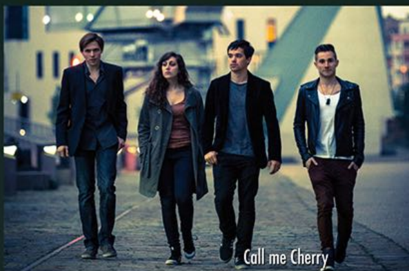
Call me Cherry